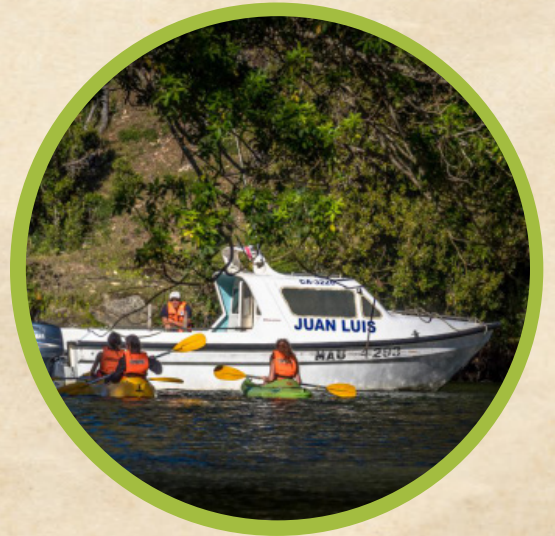
Paseo en Bote